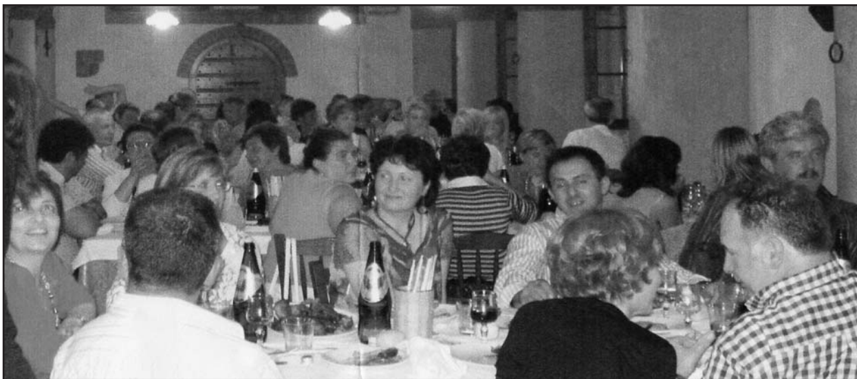
Un momento della festa dei coetanei del '58.