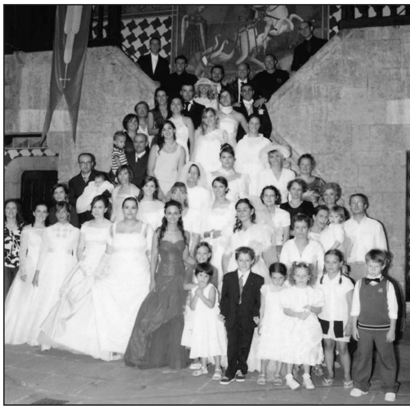
I partecipanti alla piacevole serata.