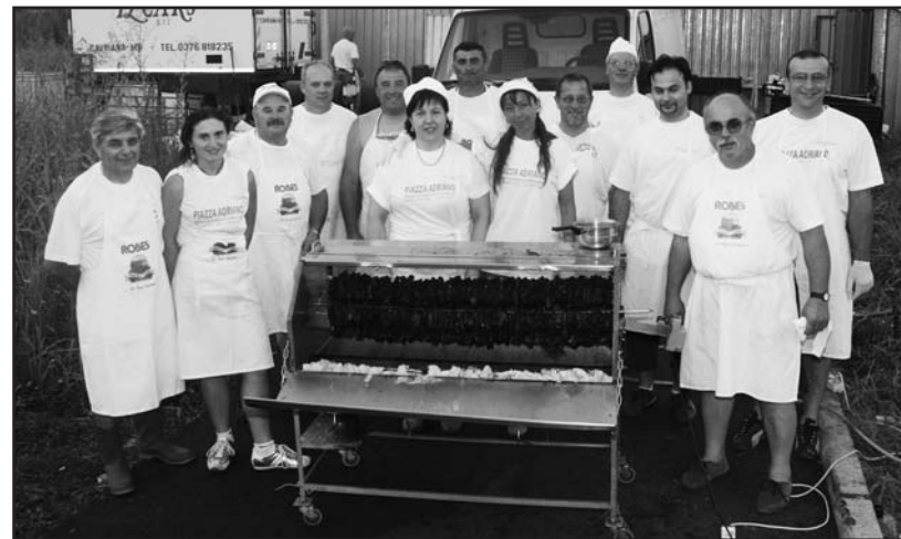
Alcuni dei volontari della festa.