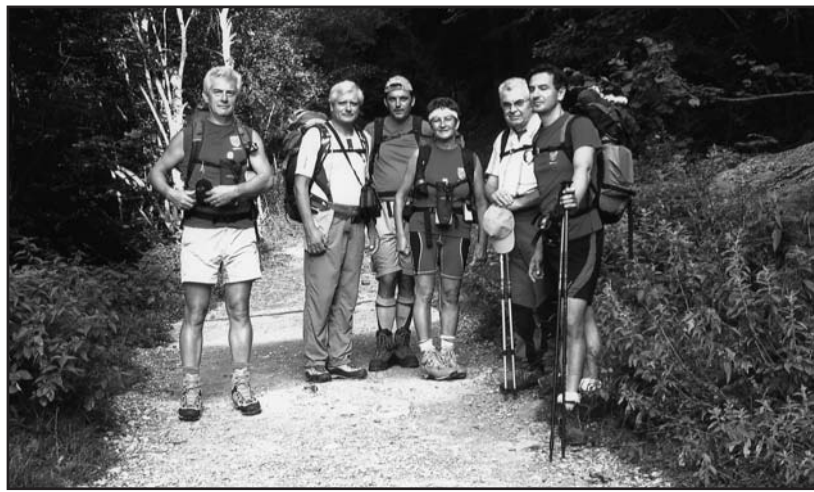
I partecipanti alla gita.

Ad avventura ultimata si può affermare che, anche se durata solo quattro giorni, essa è stata di grande intensità, poiché il gruppo quotidianamente era impegnato per almeno otto o nove ore su percorsi accidentati, tra salite e discese, neve e pietraie franose, creste da superare e funi metalliche a cui aggrapparsi.