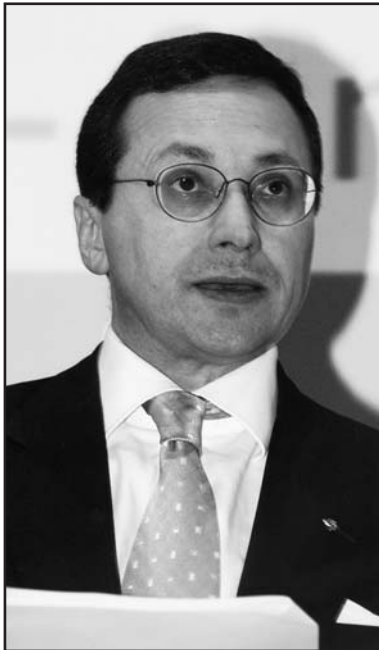
Il Presidente Azzi.

L'attuale nomina, che rappresenta un importante riconoscimento per tutto il sistema della cooperazione di credito, viene ulteriormente ad incoraggiare la politica bancaria da sempre promossa da Azzi a sostegno di quel pluralismo bancario che è rivolto a vantaggio